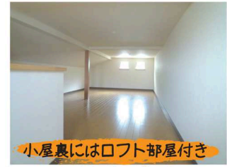
小屋裏にはロフト部屋付き