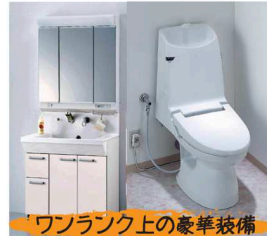
ワンランク上の豪華装備