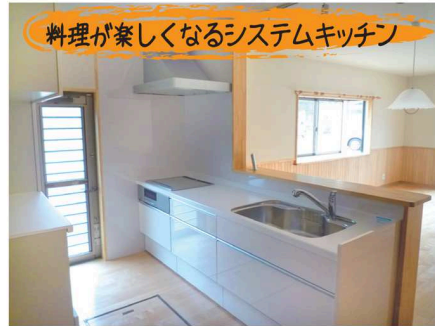
料理が楽しくなるシステムキッチン