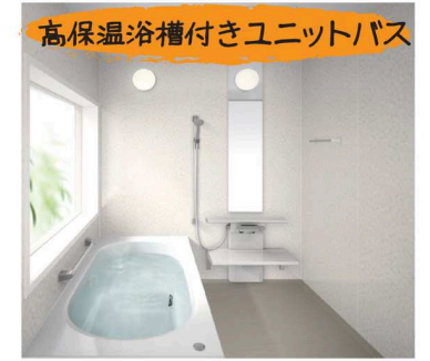
高保温浴槽付きユニットバス