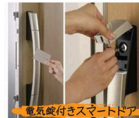
電気錠付きスマートドア